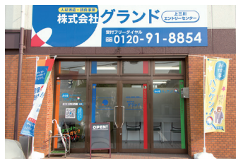
■ 上三川エントリーセンター