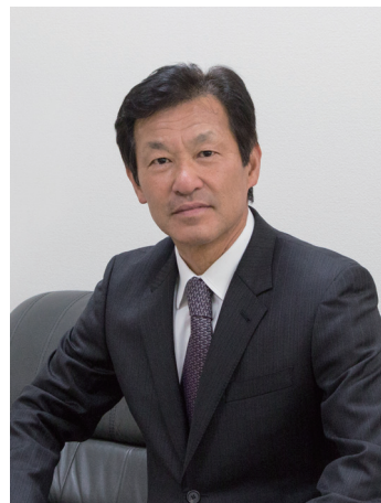
株式会社グランド 代表取締役

ものづくりと並行しサービス事業や福祉事業では、人材育成・教育に比重を置き、新たな付加価値向上の施策を積極的に進め、お客様と働く方々のご満足の為、より良いサービスの提供を目指し、日々の革新をコンセプトに皆様と共に次のステージへ向かって参ります。