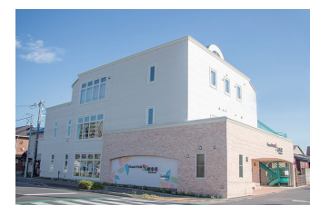
■ 高齢者介護施設 Grand F&M 四季采