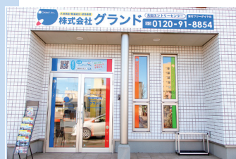
■ 太田エントリーセンター