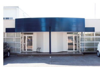
■ 宇都宮サービスステーション