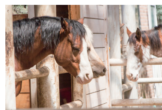
■ Grand pony club Grand pony 学童 club